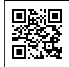
報名連結 QR Code