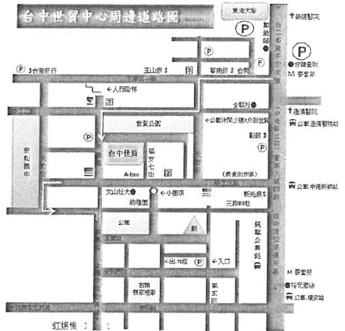
財團法人台中世界貿易中心交通資訊